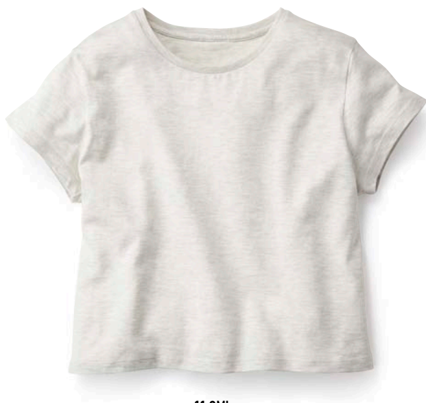
11 OML オートミール