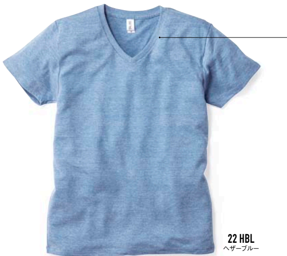
22 HBL ヘザーブルー