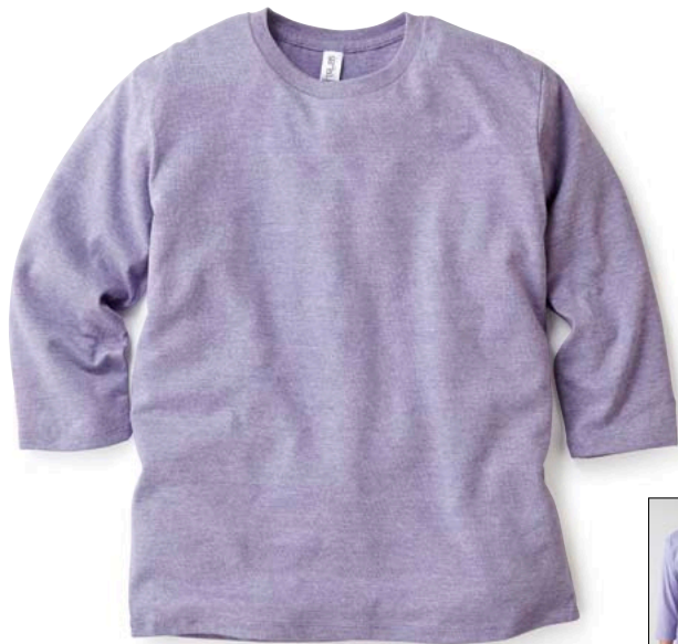
20 HPL ヘザーパープル