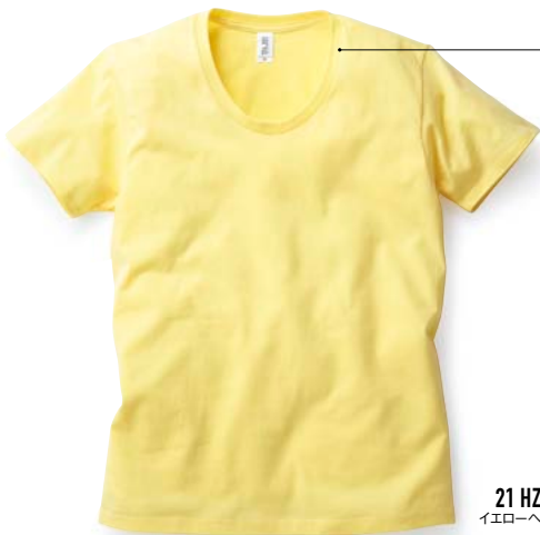
21 HZE イエローヘーゼ