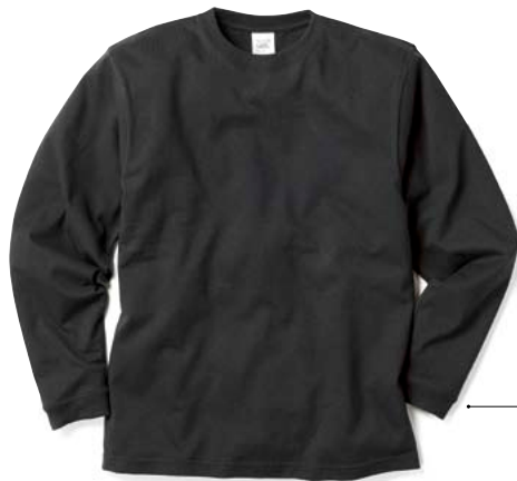
09 SBK ブラック