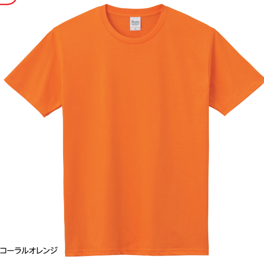
170 コーラルオレンジ